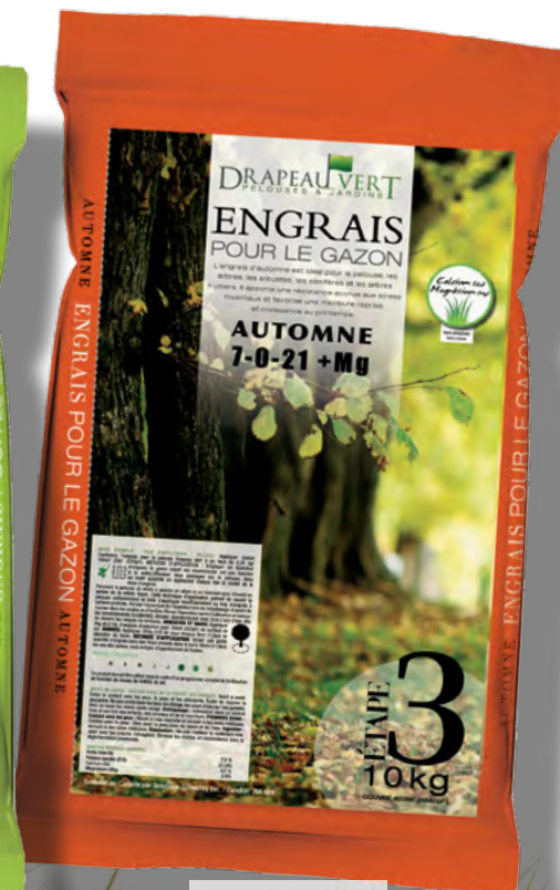
Automne/fall Étape/step 3

Sans phosphate sans nitrate phosphate and nitrate free couvre 4500 m 2 /5000 pi 2 covers 450 m 2 /5000 pi 2