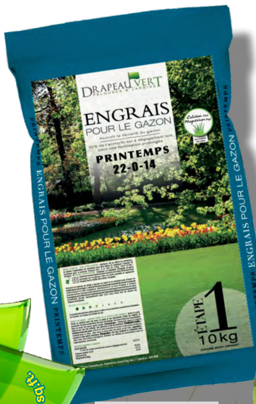
Printemps/spring Étape/step 1

GREEN FLAG DRAPEAU VERT HOME & GARDEN . PELOUSES & JARDINS