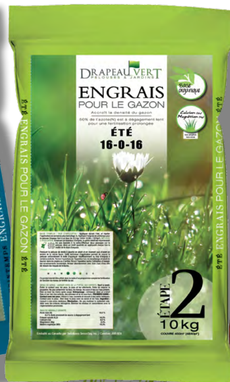
Été/summer Étape/step 2